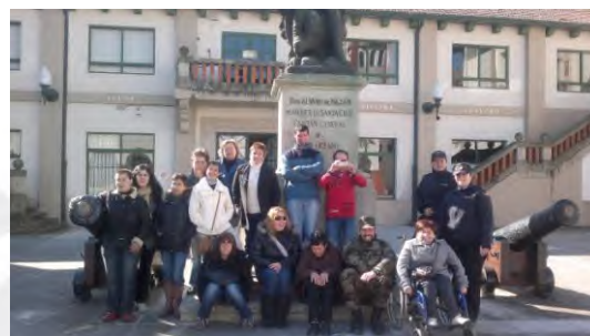
Visita a Escola Naval de Marín