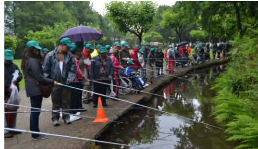
Xornada de Pesca en Val do Dubra