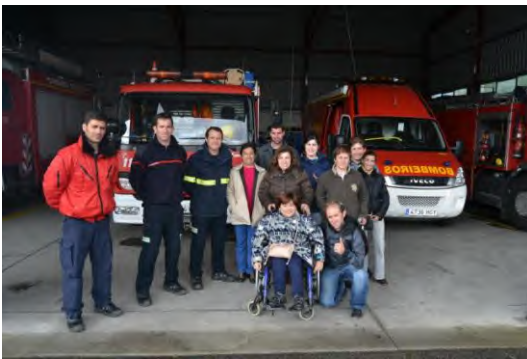
Visita ao parque de Bombeiros do Porriño